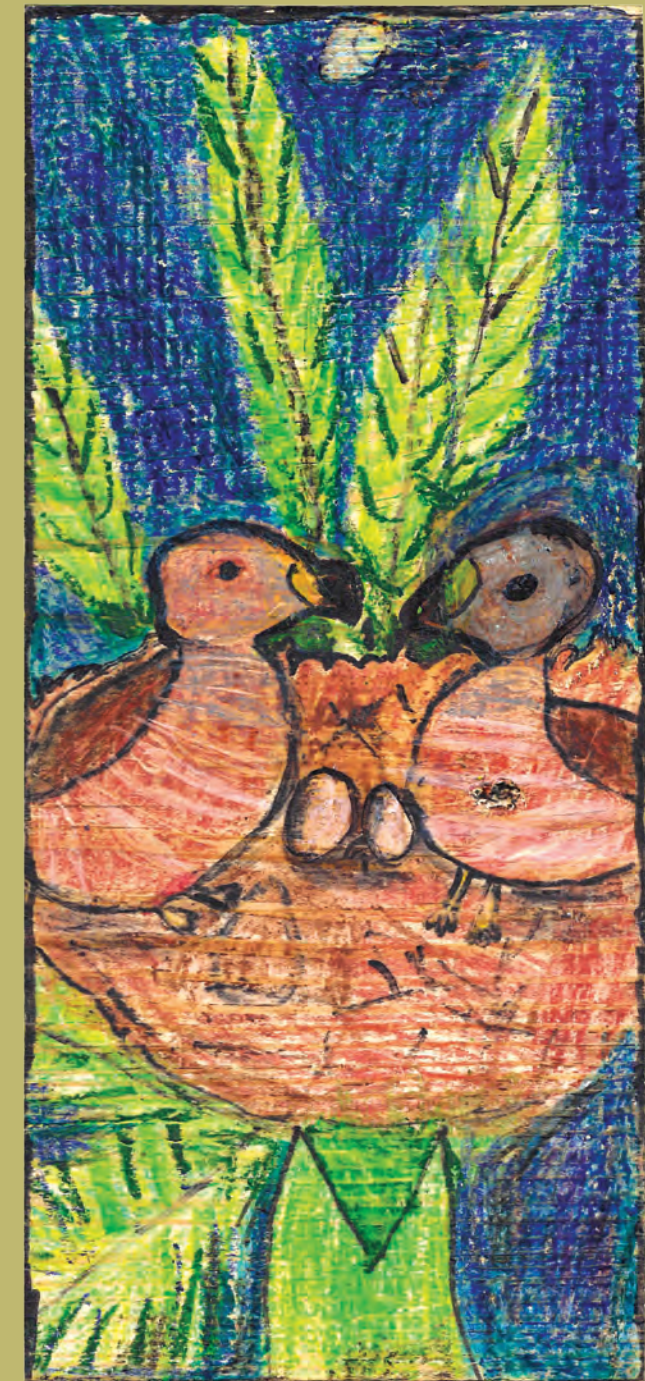
Mojave Hayes, 8 años, mayo de 2017